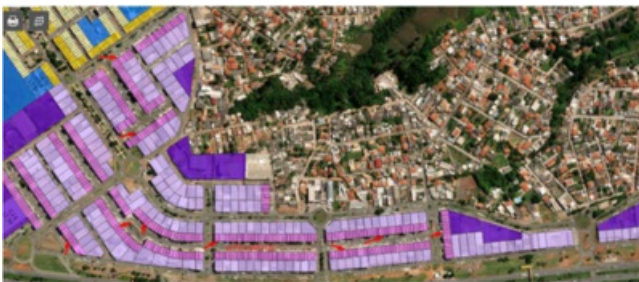
Imagem 1 - Setas vermelhas indicam os lotes mistos, com predominância de apartamentos nos pavimentos superiores

A parceria com as Secretarias envolvidas se faz necessário, tendo em vista a complexidade do cenário e das dificuldades demonstradas no setor. Em 2024 foram realizadas algumas obras que promoveram a acessibilidade e segurança dos moradores da região, com a criação de novas calçadas e recuos para estacionamento. Há projetos de arborismo e requalificação viária sendo elaborados, devendo estes, seguir o rito processual passando pela Secretaria de Estado de Desenvolvimento Urbano e Habitação - SEDUH.