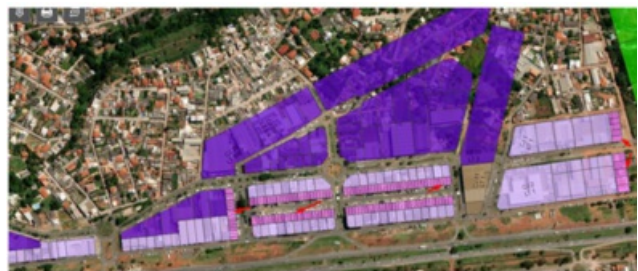
Imagem 2 - Setas vermelhas indicam os lotes mistos, com predominância de apartamento nos pavimentos superiores