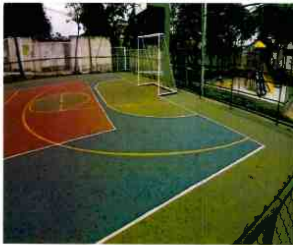
REVITALIZAÇÃO DE PRAÇA