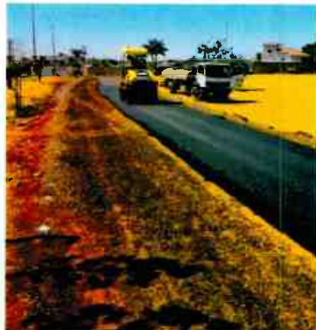
PISTA DE COOPER- PARQUE DO AREAL