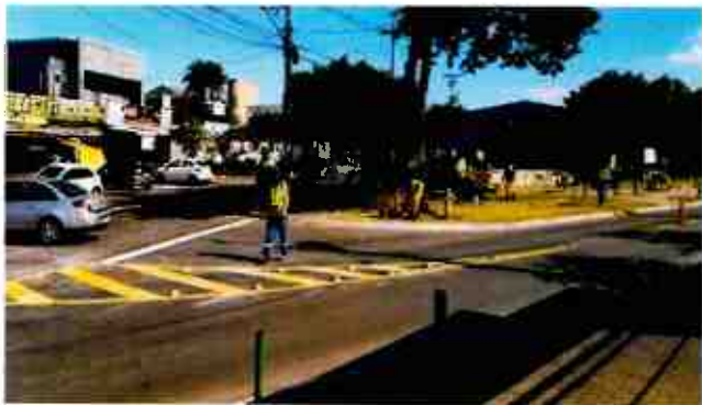
SINALIZAÇÃO- ESCOLA COC