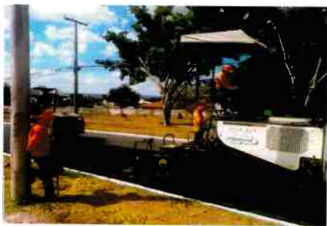
RECAPEAMENTO- AVENIDA VEREDA DA CRUZ (SHA)