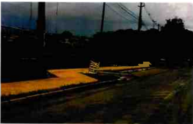
CALÇADAS- PARQUE DO AREAL