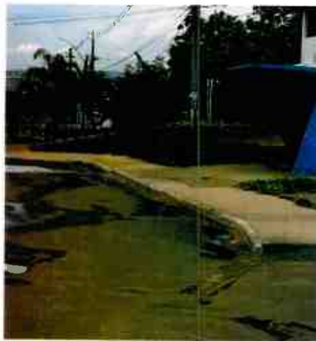
RECUO DE ABRIGO DE ÔNIBUS- SHA CONJ. 04

Em novembro de 2022 esta Administração comemorou o 3º Aniversário da Região Administrativa de Arniqueira no Parque Ecológico do Areal, com a realização de diversas atividades junto à comunidade, em parceria com o IBRAM e o SEBRAE, que doaram seus materiais, estrutura e serviço voluntário. Destaca-se a contribuição dos artesãos, empresários, atletas, artistas, dentre outros, que colaboraram de forma voluntária para a realização das seguintes festividades: